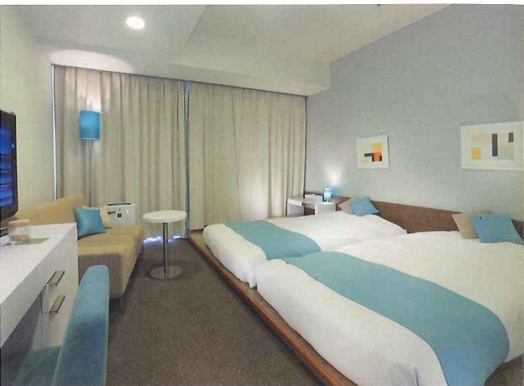
レディースツイン (22 m 2 )