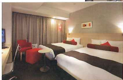
エグゼクティブワイドツイン (22 m 2 )