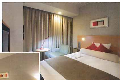
コンフォートシングル (15 m 2 )