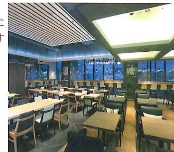
1F/ BONSLUTE CAFÉ ボンサルルーテ・カフェ

「しっかりとした朝食をとり たい」というニーズにお応え して、厳選した食材をいつも おいしい状態でご提供します 「しっかりした朝食で充実し た一日の活力を」