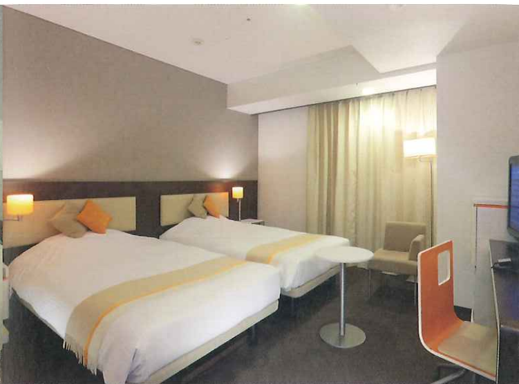
スタンダードツイン (22 m 2 )