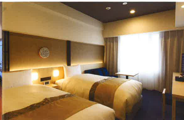
南館ツインルーム