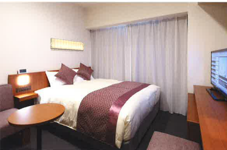
北館ダブルルーム