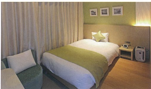
レディースルーム(フローリング)

都会の喧騒を忘れさせるほどの落ち着いた雰囲気 で、全てのお客さまにおくつろぎいただける 安らぎの空間を提供いたします。