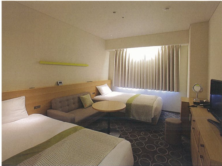
ツインルーム(一例)