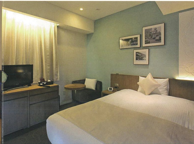
シングルルーム(一例)