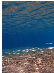
野根川を遡上する天然鮎