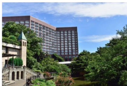
写真左上：南四国の天然遡上鮎、写真右上：徳島県海部川の中流域、 写真左下：高知県野根川の中流域、写真右下：ホテル椿山荘東京外観

本イベントは、“日本の清流を守る活動”を推進するNPO法人「ウォーターズ・リバイタルプロジェクト」とホテル椿山荘東京とのコラボレーションにより実施いたします。