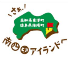
海陽町・東洋町の友好マーク