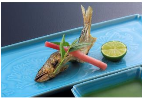
野根川鮎の塩焼き

鮎は、古事記にも吉兆を呼ぶ魚として紹介されるほど大変縁起の良い魚。ぜひこの機会に、大切な方と、魅力のたっぷり詰まった美食とともに非日常の至福の夏をお過ごしください。