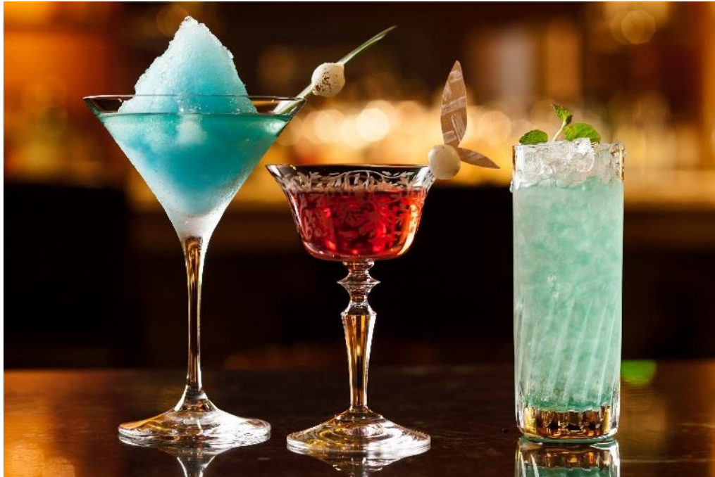
メンバー「ル・マーキー」 Firefly Cocktail Selection

この期間、メンバー「ル・マーキー」では、蛍観賞の余韻をご堪能いただけるカクテル、「Firefly Cocktail Selection」をご用意いたします。夕映えに飛翔する蛍をイメージしたワインベースのカクテルに、愛らしいカクテルオニオンをあしらった「イリュージョン・ダンス」（写真中央）など、蛍の儂げな瞬きを、大人の魅惑的な夜を彩るグラスの中に閉じ込めました。