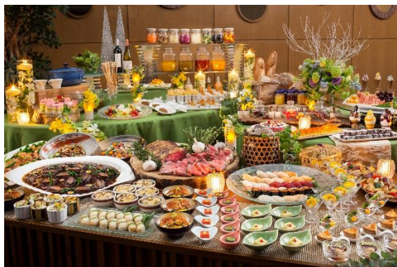
イル・テアトロ LE LUCCHIOLE イメージ