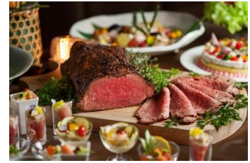
サーロインローストビーフ

今年のメイン料理は、サーロインローストビーフと鮑料理。人気のサーロインローストビーフは目の前でお取り分け。海の高級食材「鮑」を中華の王道オイスターソース煮込みやにぎり寿司、ミニ井ぶりなどをおもう存分どうぞ。そのほか、ひつまぶしで味わう「鰻料理」やホテル伝統の「米茄子の鴨炊き」、「特製ビーフシチュー」など、洗練されたお料理をご用意しました。お食事の後半には、炎の演出が幻想的な「チェリージュビレ」などのパフォーマンスとともにデザートもお楽しみいただけます。煌めく蛍と華やかな数々の料理とともに、家族や大切な人との特別な時間をお過ごしください。