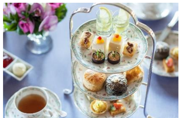
「蛍アフタヌーンティー」