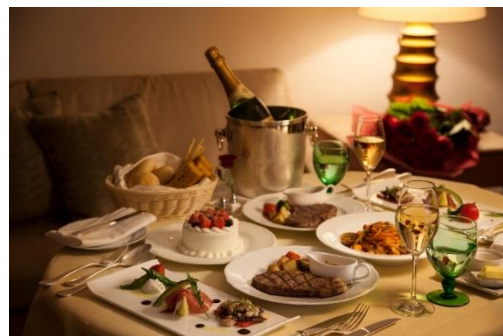
ステイプラン『スイートアニバーサリー』ルームサービスイメージ

ステイプラン『スイートアニバーサリー』は、普段は仕事や家事で忙しく二人の時間がなかなかとれないご夫婦へ。都会の喧噪を忘れさせる優雅なスイートルームで、ルームサービスでのディナー、ボトルでのスパークリングワイン、翌朝には、選べるご朝食など、ご夫婦揃って、ゆったりとした時間を存分にお過ごしいただけます。またスイートルームご宿泊者様限定のパゴダラウンジもご利用いただけます。ご夫婦だけでなく、プロポーズ、記念日のお祝い、クリスマスのプレゼントとしてもおすすめです。