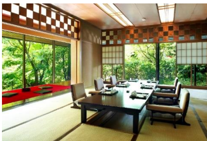
上：料亭「錦水」、下：料亭「錦水」個室イメージ

料亭「錦水」は、ホテル椿山荘東京の緑溢れる庭園内に建つ、数寄屋造りの料亭。半世紀以上受け継がれてきた味と技で、和食の料理人たちが丹精こめて大切ひとときにふさわしいお料理をご用意いたします。鯛の塩釜焼き、お祝いにちなんだ前菜、薬膳鍋、華やかなお造りなどの会席料理をお楽しみいただきます。鯛の塩釜焼きは、木槌で叩いてお召し上がりいただきます。おふたり揃っての共同作業に、思わず笑顔がこぼれることでしょう。また、貴重な一日の記念として、ホテル椿山荘東京の写真室で記念写真をお撮りいたします。豊かな自然、笑顔、特別な料理とともに、ご家族皆様で晴れやかなひとときを。